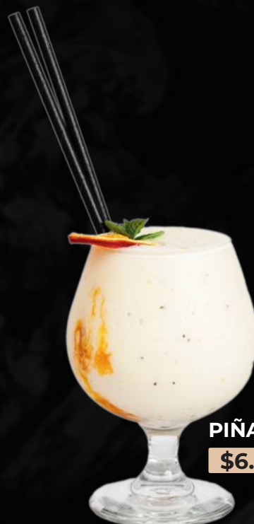
PIÑA COLADA $6.990