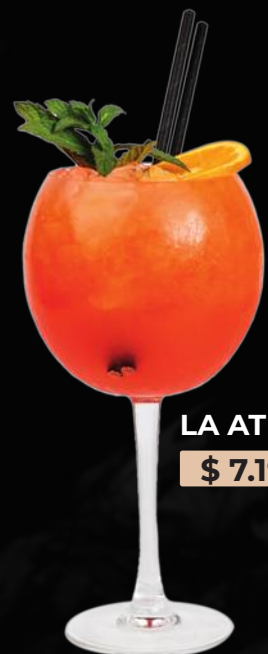
LA ATREVIDA $ 7.190