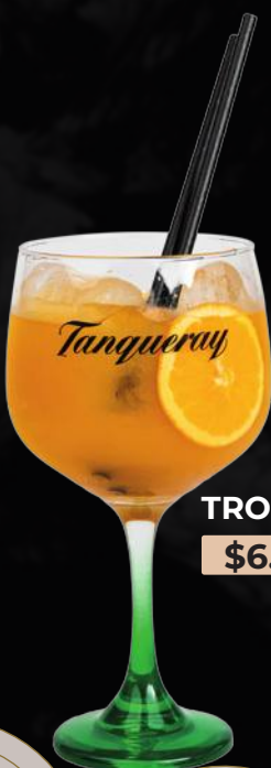
TROPICAL GIN $6.990