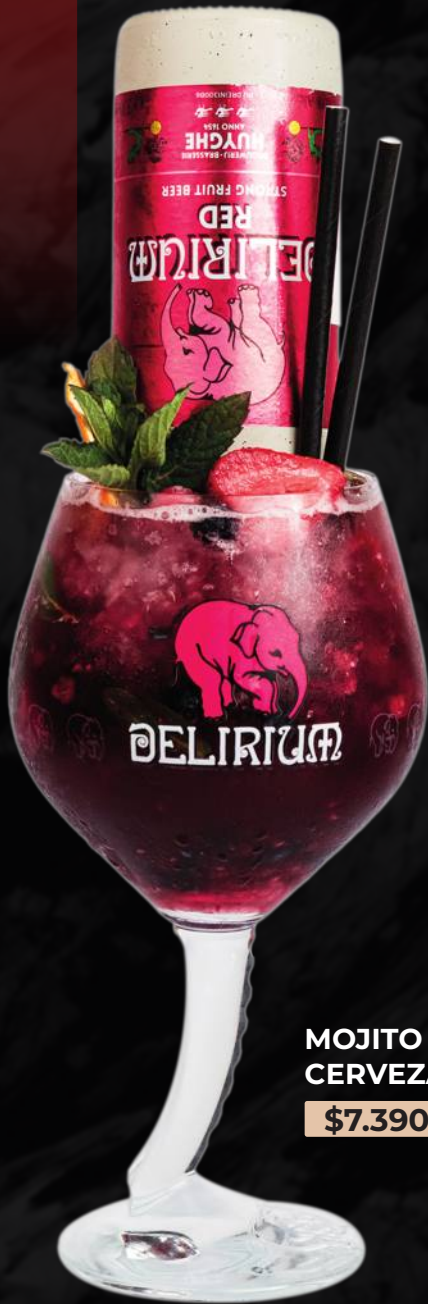
MOJITO CERVEZA $7.390