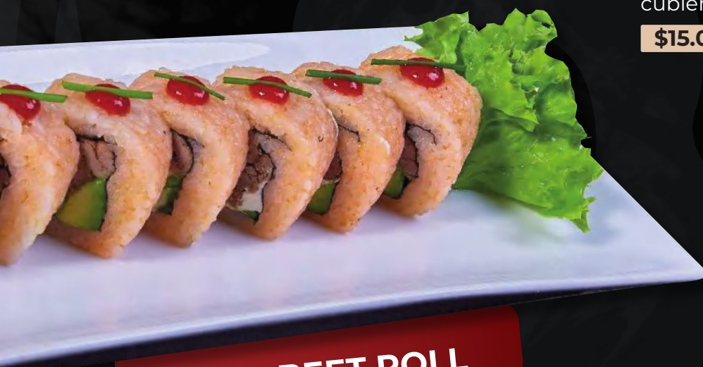
RED BEET ROLL